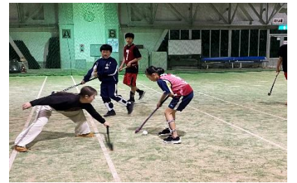
ホッケー(夜間レッスン)