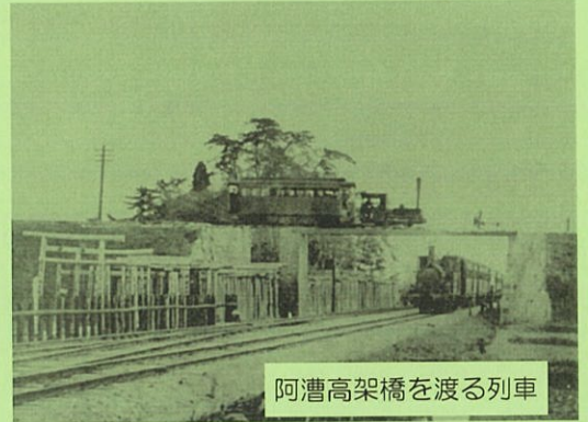
阿漕高架橋を渡る列車

津市岩田橋から白山町川口までの20.7kmの区間で、大正14年全線開通から昭和18年まで営業をし、地域の人々の足として利用されていた中勢鉄道。その線路跡をたどってみましょう。中勢鉄道には、岩田橋、弁財町、阿漕、聖天前、二重池、相川、久居、寺町、万町、戸木、羽野、大師前、七栗、其倉、石橋、片山、大仰、誕生寺、亀ヶ広、伊勢二本木、広瀬、伊勢川口の22駅がありました。