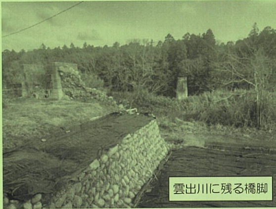
雲出川に残る橋脚