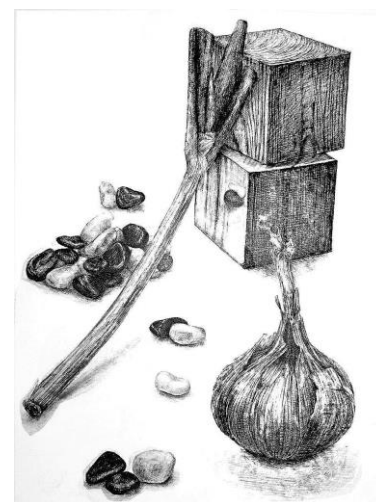
指導スタッフの作品一例