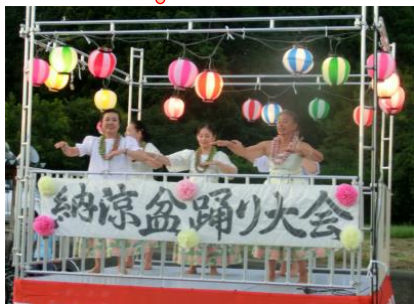
オハナフラクラブ様によるフラダンス披露