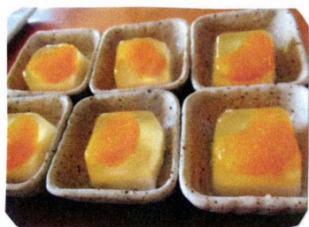
ひんやりゼリーを作りました