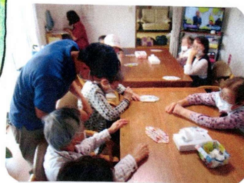
送迎前のひとときの時間 指が消えるマジックを披露中