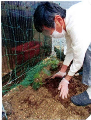
今年もきゅうりの苗を植えました

お蚕さんは、大きく成長するにつれて食欲がまして 手のひら位の大きさの桑の葉をムシャムシャ食べつくすの。うんちやおしっこもたくさんするからまゆまくまでが忙しくてな。ほうてる子供をお母さんは、おぶって寝やんと世話をしたもんや。昔の人はよう働いたんよ。この前のことのように思い出すわ。と 教えて 頂きました。