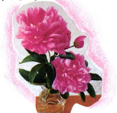
利用者様から頂いた芍薬の花 立てば芍薬 座れば牡丹 歩く姿は百合の花 のお言葉を添えて...