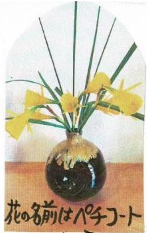
花の名前はパチジョト

4月号でご紹介しました、和紙が完成しました。水につけふやかした牛乳パックの内側の紙をミキサーでトドロにして型に流し入れます。なかはななどは、型は、写真たての枠にあめのネットを貼り用紙しました。花やつくしの押し花を飾り、乾かして出来あがりです。